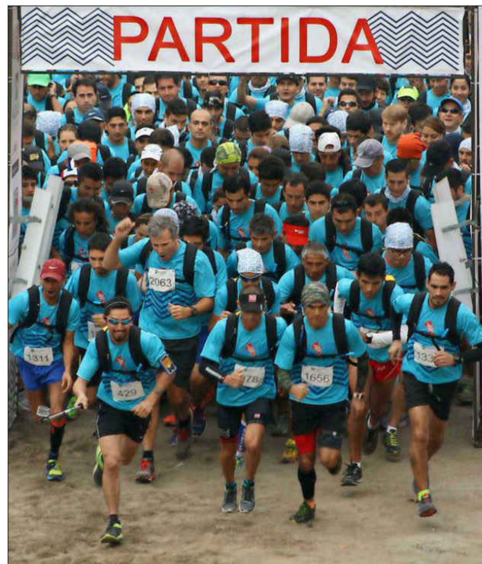
La partida de la corrida.

La Fundación Astoreca, que cumple 25 años, cuenta con tres colegios particulares subvencionados gratuitos en las comunas de Renca y Lampa, y da educación de calidad a cerca de dos mil niños vulnerables.