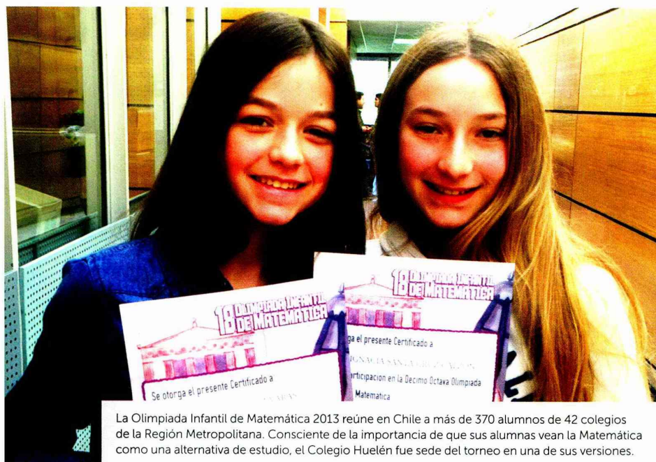
La Olimpiada Infantil de Matemática 2013 reúne en Chile a más de 370 alumnos de 42 colegios de la Región Metropolitana. Consciente de la importancia de que sus alumnas vean la Matemática como una alternativa de estudio, el Colegio Huelén fue sede del torneo en una de sus versiones.

La evidencia, en cambio, muestra que las razones son socioculturales y que están arraigadas en el sistema educacional. Se ha visto que ante un alumno con mal desempeño en Matemática los profesores tienden a ayudarlo si es hombre y a ofrecerle otros caminos si es mujer. Por otro lado, en el discurso de los profesores y en los textos escolares se muestra al hombre en campos como ingeniería, ciencia, construcción y medicina, y a las mujeres en terrenos de cuidado, docencia o comunicaciones, resaltando su empatía. Así se han ido construyendo modelos a seguir, también respaldados por los padres.