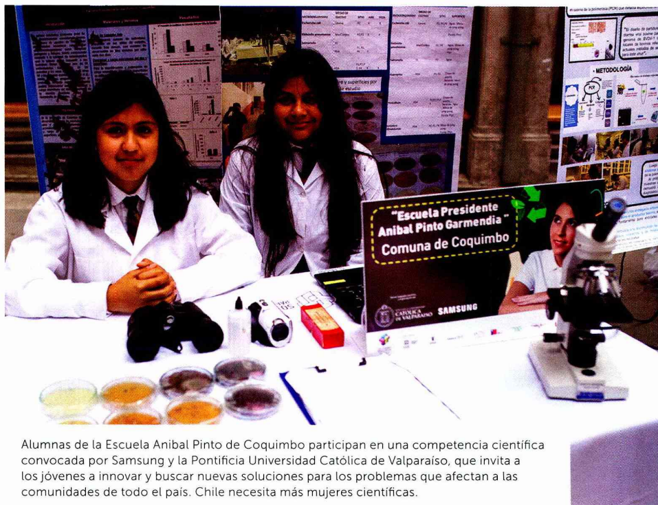
Alumnas de la Escuela Anibal Pinto de Coquimbo participan en una competencia científica convocada por Samsung y la Pontificia Universidad Católica de Valparaíso, que invita a los jóvenes a innovar y buscar nuevas soluciones para los problemas que afectan a las comunidades de todo el país. Chile necesita más mujeres científicas.

Es así como finalmente los hombres se matriculan en carreras asociadas a una mejor remuneración en el futuro, como son las vinculadas a Ciencia, Tecnología, Ingeniería y Matemática (CTIM), donde solo hay un 27% de mujeres.