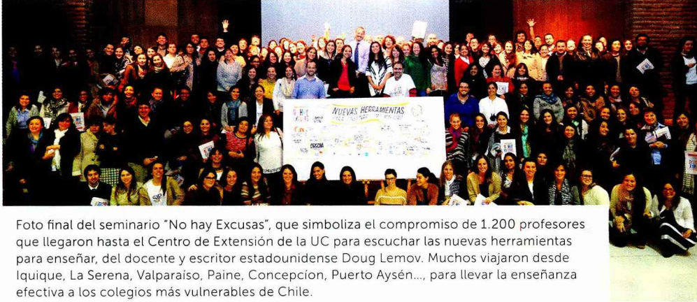
Foto final del seminario "No hay Excusas", que simboliza el compromiso de 1.200 profesores que llegaron hasta el Centro de Extensión de la UC para escuchar las nuevas herramientas para enseñar, del docente y escritor estadounidense Doug Lemov. Muchos viajaron desde Iquique, La Serena, Valparaíso, Paine, Concepción, Puerto Aysén..., para llevar la enseñanza efectiva a los colegios más vulnerables de Chile.

Tiraje: Sin Datos Lectoría: Sin Datos Tono: No Definido