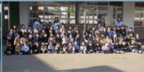
San José de Lampa