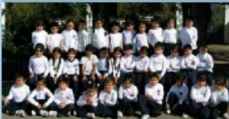
San Joaquín de Renca

Invitamos a que se acerquen quienes quieran comprometerse a apadrinar a uno de estos niños y ayudar a financiar una educación de excelencia.