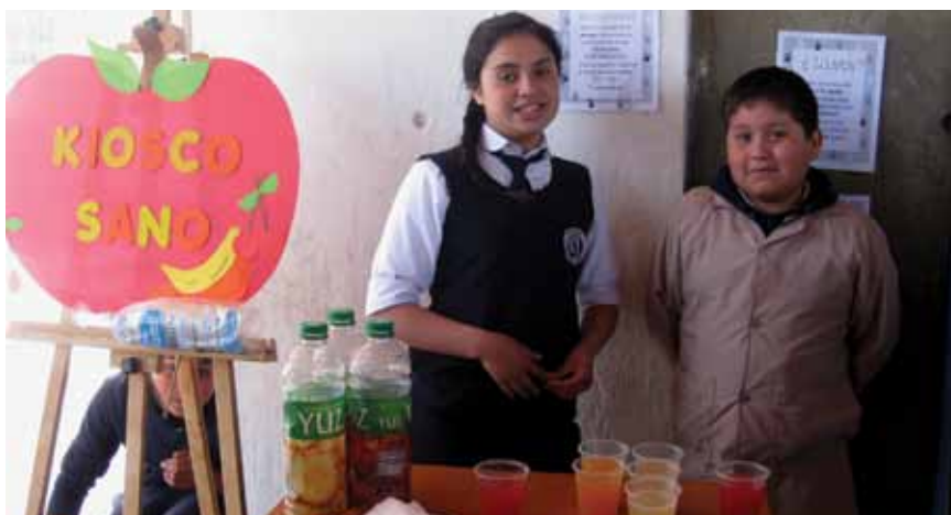
© Beatriz Urtubia (7ºA) y Nicolás Erice (6ºB)