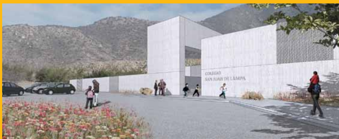
Vista del acceso al colegio ➤

El Colegio San Juan está a cargo de un Directorio conformado por 19 profesionales, quienes están en una fuerte campaña para recaudar los fondos necesarios para su construcción y puesta en marcha.