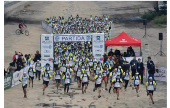
Los 800 participantes en la partida de la carrera.

Una inédita carrera en Chile organizó Astoreca en conjunto con Aguas Andinas y la productora Olimpo. El pasado 18 de mayo 800 competidores bajaron en puente Pío Nono al lecho del río Mapocho y corrieron hasta el puente Lo Curro.