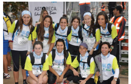
Parte del equipo Astoreca que participó en la competencia.

Los 330 alumnos de prekinder a 2º básico participaron activamente en esta ceremonia en la que nos acompañaron los principales donantes de esta primera etapa de construcción: Banco de Chile, Fundación Claro Vial, Fundación San Carlos de Maipo, Fundación Careno, Fundación Mustakis, entre otros. Gracias a todos ellos por ayudarnos en este proyecto que recién comienza.